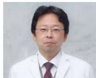
大曲 貴夫 (国際感染症センター長)