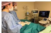
为了维护肾脏健康 我们在包括肾穿刺活检在内的科学诊断基础上，针对不同病情，提供恰当的个体化治疗方案。