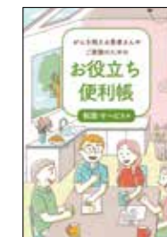
がんを抱える患者さんや ご家族のための お役立ち便利帳 制度・サービス編