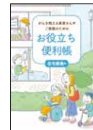
がんを抱える患者さんや ご家族のための お役立ち便利帳 在宅療養編