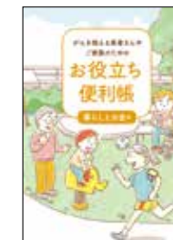
がんを抱える患者さんや ご家族のための お役立ち便利帳 暮らしとお金編