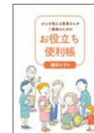
がんを抱える患者さんや ご家族のための お役立ち便利帳 緩和ケア編