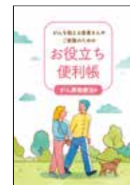
がんを抱える患者さんや ご家族のための お役立ち便利帳 がん薬物療法編